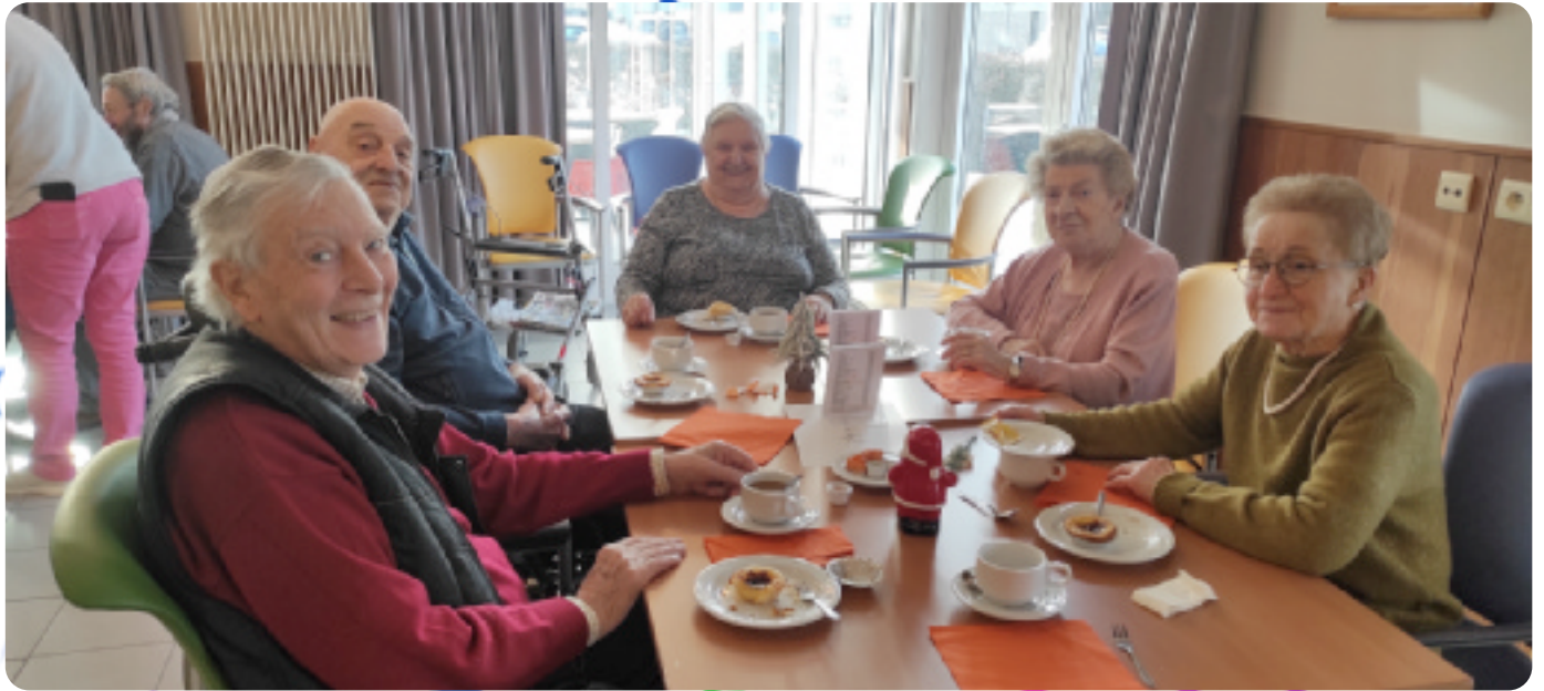
Ook het personeel werd verwend met een heel gezellig nieuwjaarsfeest!